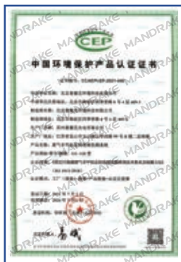
GC-118型挥发性有机物在线监测系统环保认证证书