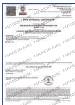
法国船级社型式认可证书