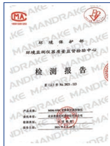
MDK-S301型数据采集 传输仪检测报告