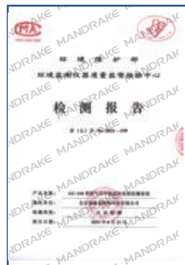
GC-118型挥发性有机物在线监测系统检测报告