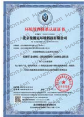
ISO环境管理体系认证证书