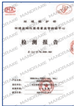
MDK116-A型烟气排放连续 监测系统检测报告