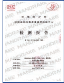
MDK116-B型烟气排放连续 监测系统认证检测报告