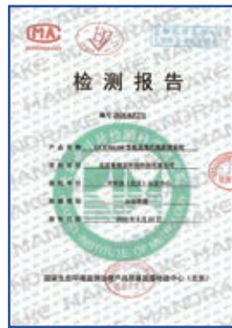
GCEM6100型氨逃逸在线监测系统检测报告