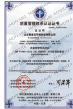
ISO质量管理体系认证证书