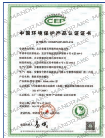
MDK-S301型数据采集 传输仪环保认证