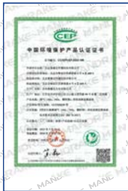
GCEM4100型 烟气排放连续监测系统