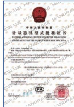
GC-118型挥发性有机物计量器具型式批准证书