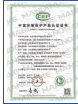
MDK116-B型烟气排放连续 监测系统环保认证证书