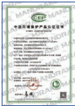
GCEM6100型氨逃逸在线监测系统环保认证证书