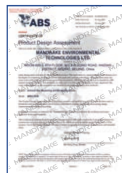
美国船级社型式认可证书