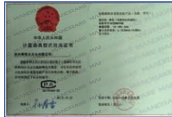
VCEM5100型计量器具型式批准证书