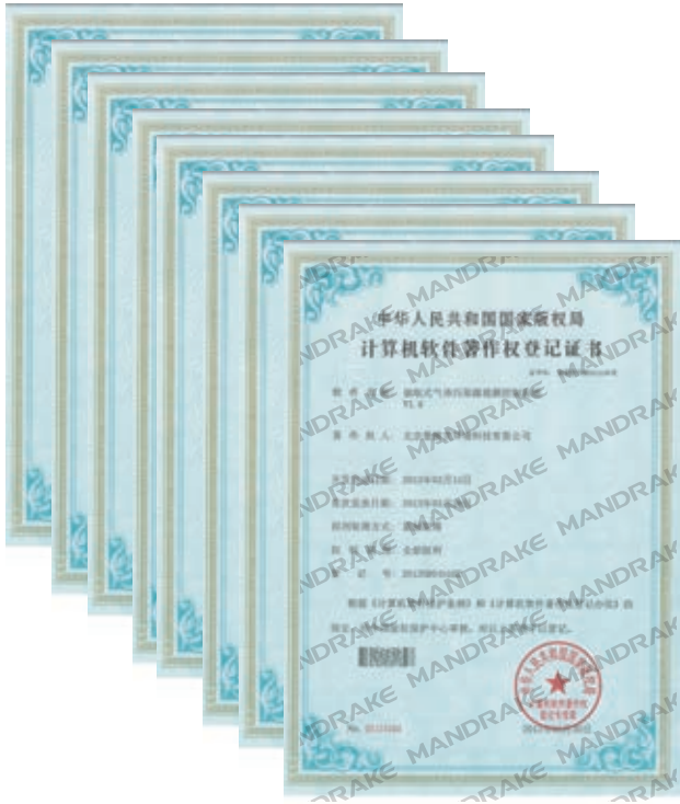
抽取式气体污染源检测控制系统 软件著作权等 百十余项软件著作权