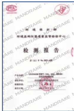
GCEM4100型 烟气排放连续监测系统