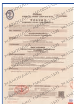
中国船级社型式认可证书