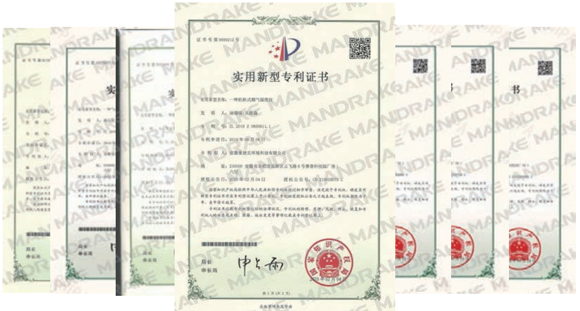
柜式湿度仪实用新型专利等 百十余项专利