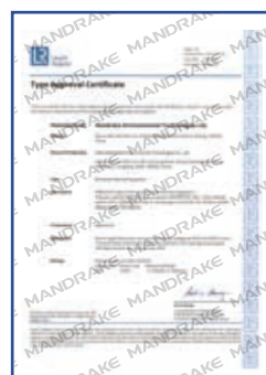
英国船级社型式认可证书