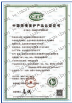
MDK116-A型烟气排放连续 监测系统环保认证证书