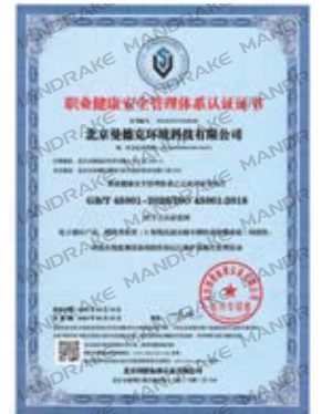
ISO职业健康安全管理体系认证证书